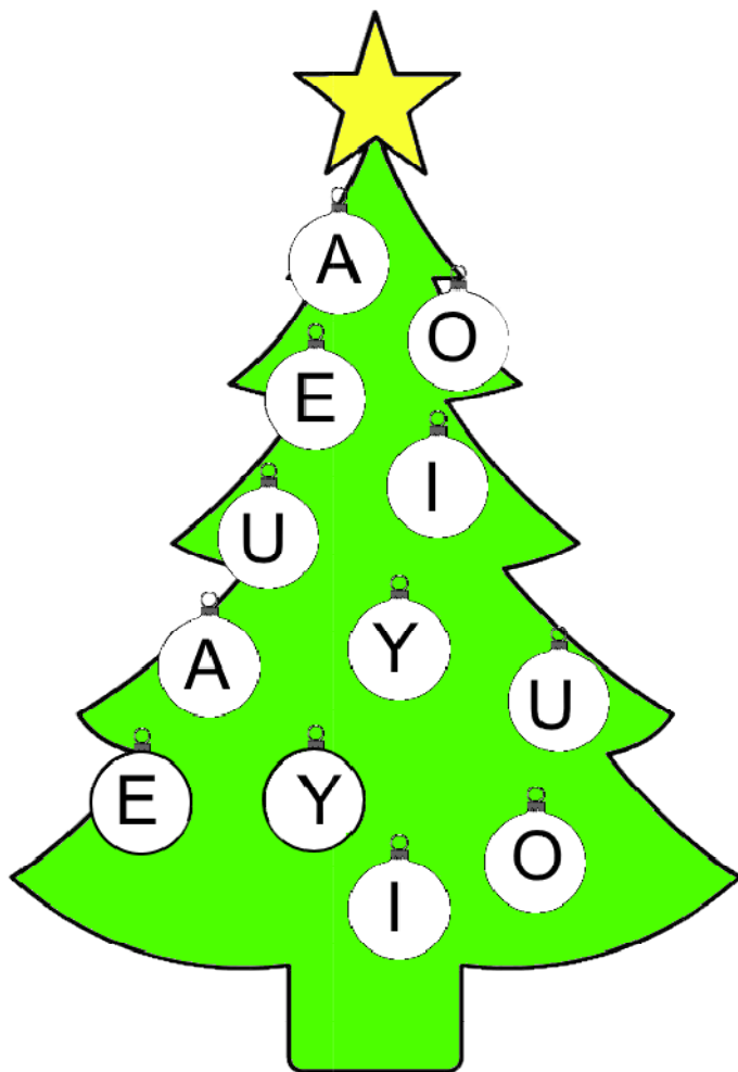
Rysunek 3: Choinka samogłoskowa 3