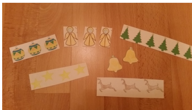
Rysunek 1: Elementy bożonarodzeniowe 1