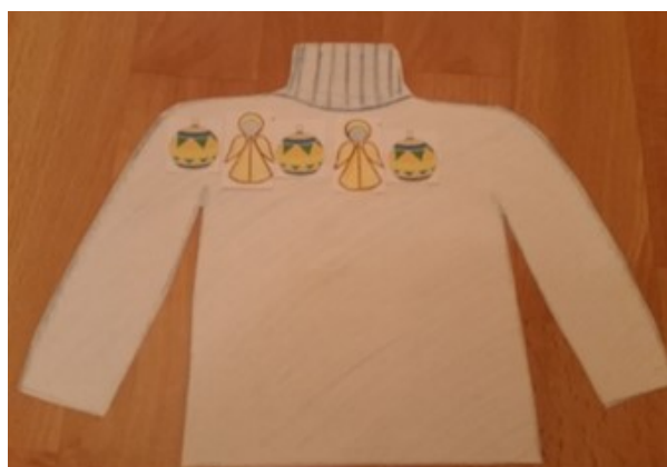
Rysunek 2: Bożonarodzeniowy sweter Antka 2